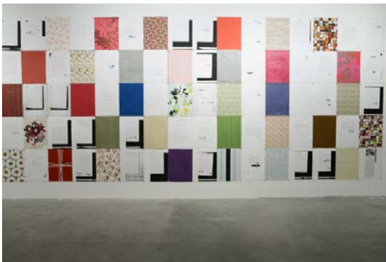
Letters to an Army of Three, 2005 Dibujo sobre papel