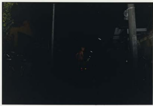
Untitled, 1994 Fotografía color 50x60cm