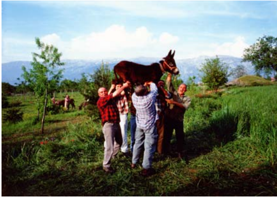
Mondo alla Rovescia, 2002 Framed photographic print 180x240cm