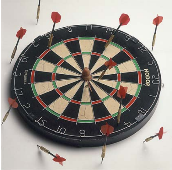
Bull's Eye, 1992 Diana de dardos, tetina de vaca, 26 dardos 46 x 8.5 cm Cortesía de la artista y Kerlin Gallery, Dublin