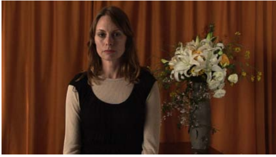
Letters to an Army of Three, 2005 Video 55'54''