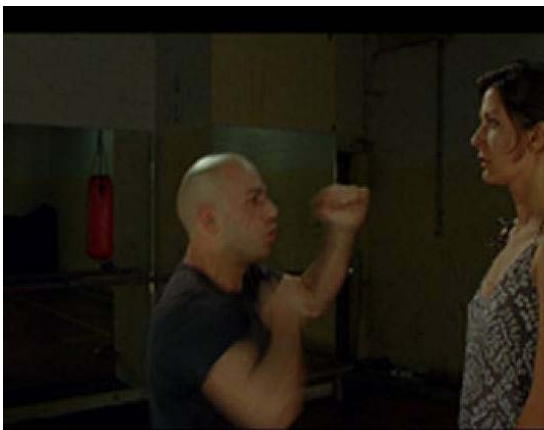
Shadow Boxing, 2004