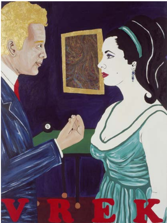
Vrek Liz Taylor Series (The VIPS), 2002 200x160cm