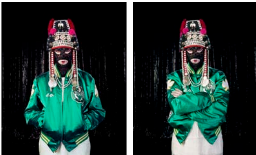
Feral's Live Performance at the 'Mingland Party', at Antisocial, London, 2007 Video 4'11'' Frontal View No.1 of White, British Female, UK Born Three Quarter profile View No.1 of White British Female Frontal View No.2 of White British Female, UK Born