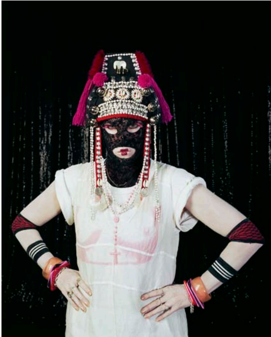
Frontal View No.4 of White British Female, UK Born