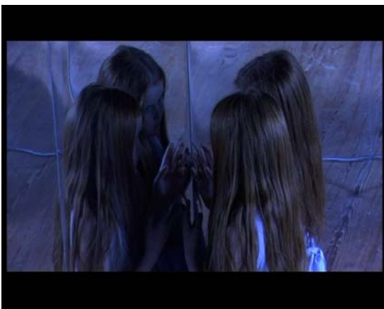
Prompt Book, 2005 Video 14´