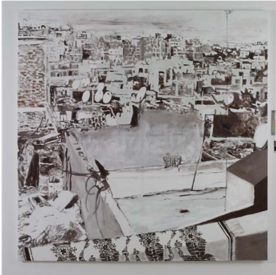
Tánger, 2005 Acrílico s/tela 200 x 200