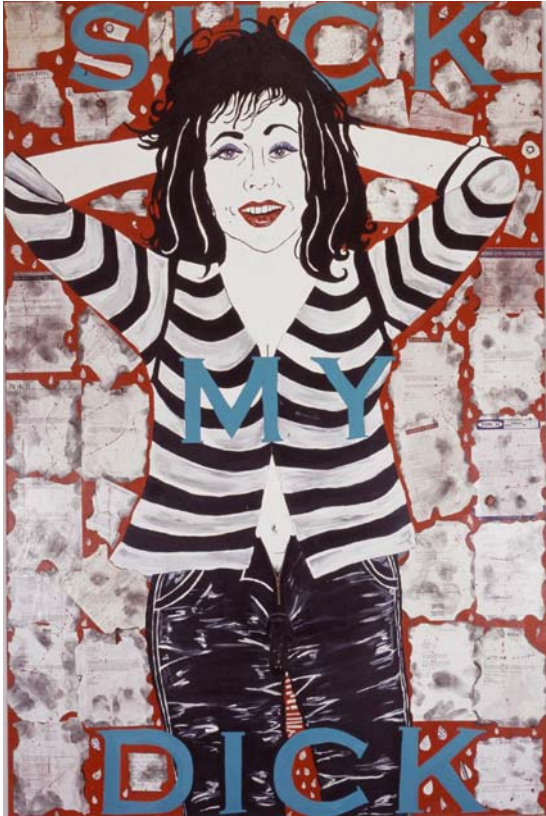
Suck my dick 2002