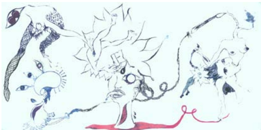
Instalación con pintura y collage