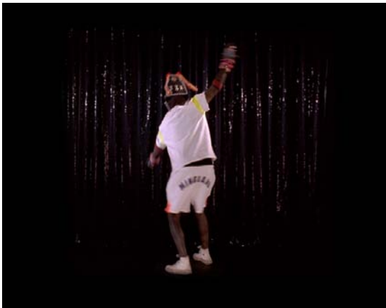
Swivel Part III, 2007 Video 1'36''