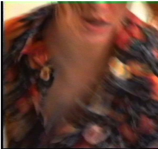
Red Light, 1995 Video 3min9seg

Vive y trabaja en Nueva York y San Sebastián