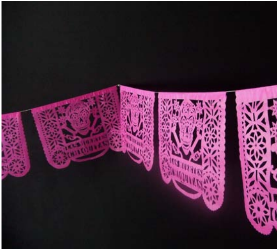
Las muertes chiquitas, 2008 Instalación