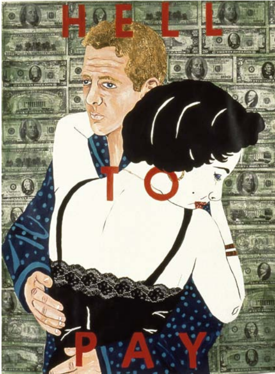
Hell to Pay Liz Taylor Series (Cat on a Hot Tin Roof), 2001 Técnica mixta sobre papel 127x111cm