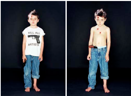
Kill Bullet boy From the Dyptic 'Written all over your face', 2004 Fotografía 100x80cm Cortesía de la artista