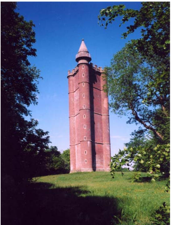
The woman who saw herself disappear, 2006 Video 8´40´´ Cortesía de la artista y Yvon-Lambert, París Producido por Anna Leska Films y C.N.A.P.