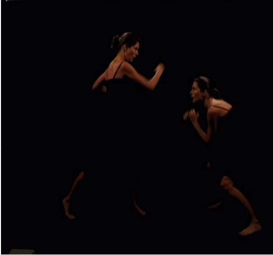
Random Fight, 2004 video proyección 12 clips de 20seg