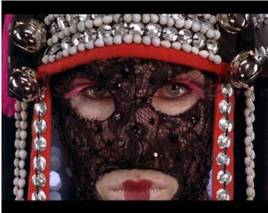
Swivel Part I, 2007 Video 3'34''