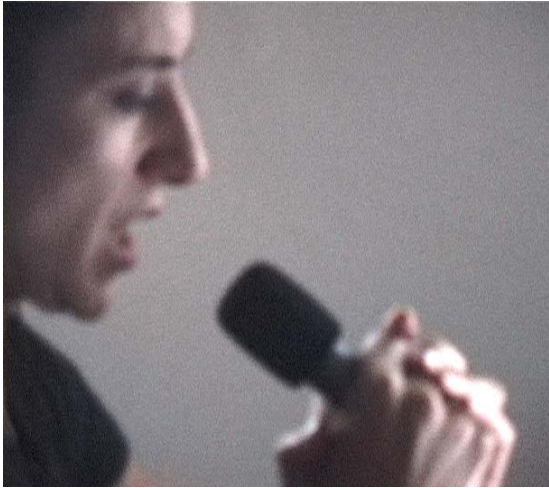
Irrintzi. Repetition 90, 91, 92, 93, 94, 95, 96, 2006 Video 6min25seg