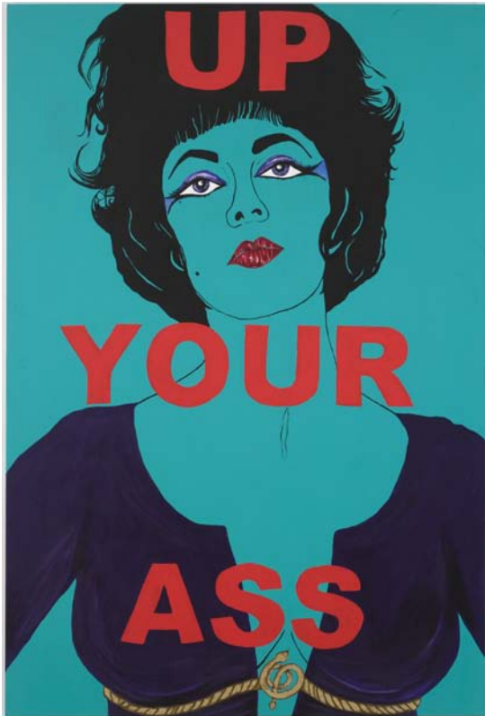
Up Your Ass Liz Taylor Series (Cleopatra), 2006 Acrílico y técnica mixta sobre lienzo 228x152cm

Vive y trabaja en Nueva York y Amsterdam