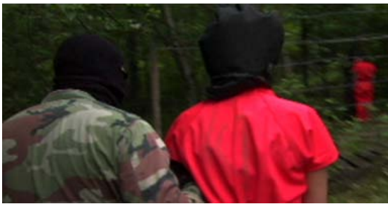
Operation Atropos, 2006