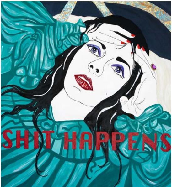
Shit Happens Liz Taylor Series (Night Watch), 2007 Acrílico y técnica mixta sobre lienzo 106x116cm