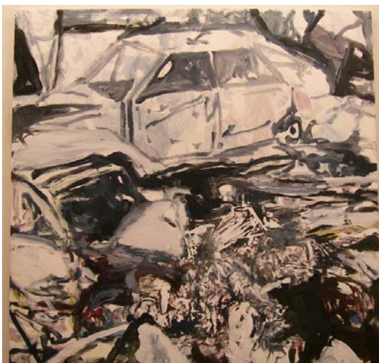
Coche 3 (Serie Target), 2006