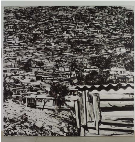
Favela Negra (Serie Target), 2005. Técnica mixta sobre tela 270 x 270 cm