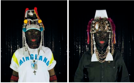
Close-up View No.1 of White British Female, UK Born Close-up View No.2 of White British Female, UK Born