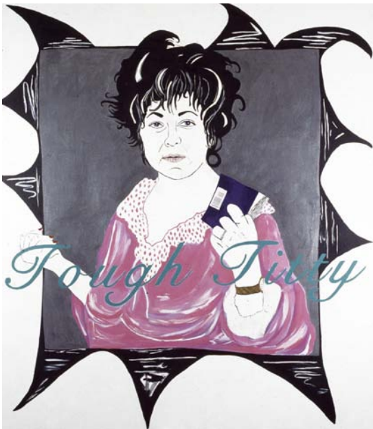
Tough Titty Liz Taylor Series (Paparazzi shot) 1999 149x99cm