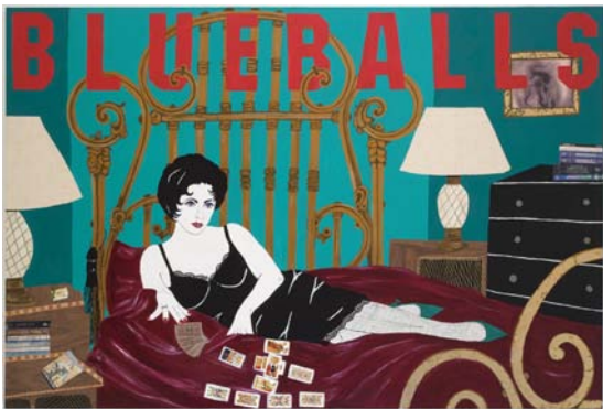
Blueballs Liz Taylor Series (Cat on a Hot Tin Roof), 2007 Acrílico, huellas digitales, sobre lienzo 182x274cm