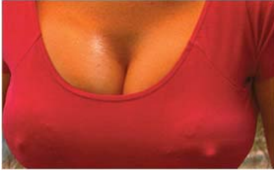
Furor latino Acción para video 2´27´´ © Pilar Albarracín