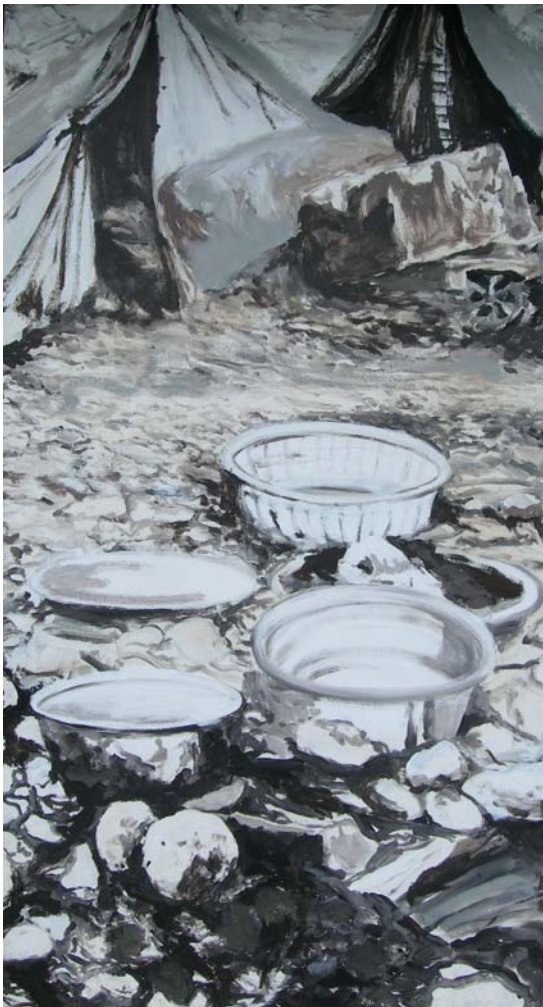
Nada (Empty Basins), 2007