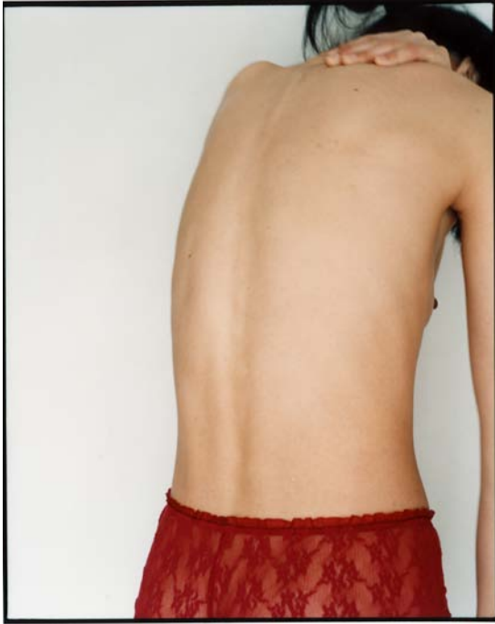
Untitled, 2004 Fotografía color sobre tabla 89x70cm